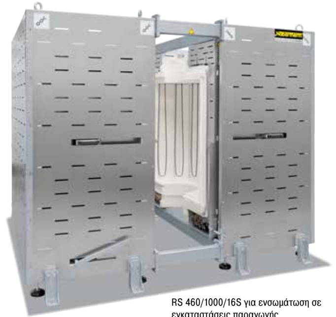
RS 460/1000/16S για ενσωμάτωση σε εγκαταστάσεις παραγωγής

Χάρη στη μεγάλη ευελιξία και καινοτομία, η Nabertherm διαθέτει την καλύτερη λύση για ειδικές εφαρμογές στα μέτρα του πελάτη.