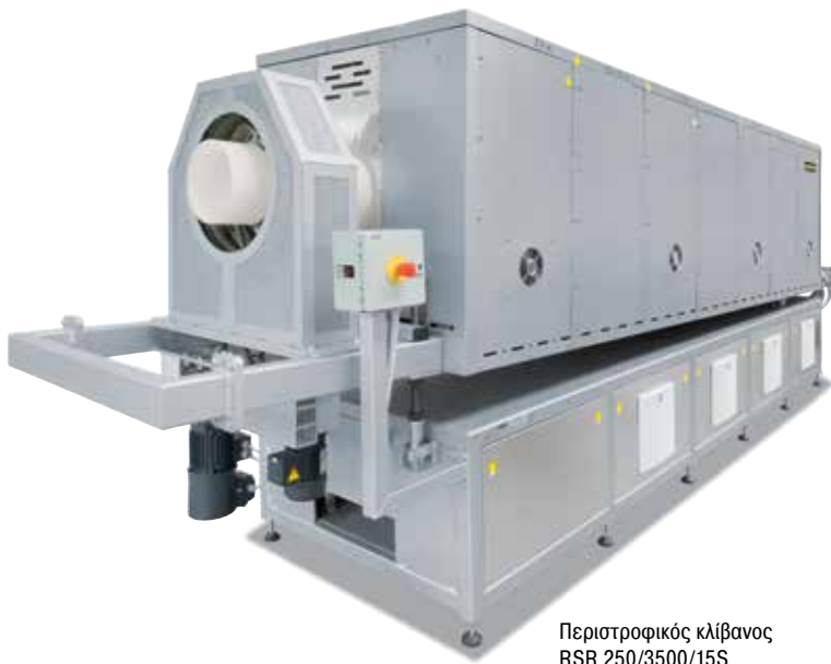
Περιστροφικός κλίβανος RSR 250/3500/15S