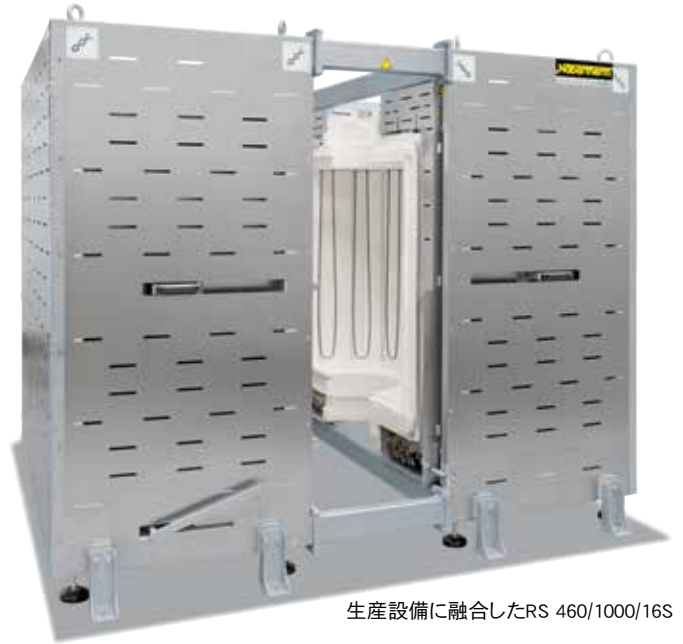
生産設備に融合したRS 460/1000/16S

高度のフレキシビリティと技術革新によってナーバザム社は、ユーザー固有の使用目的のための最適の解決策を提供します。