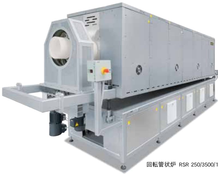
回転管状炉 RSR 250/3500/15S