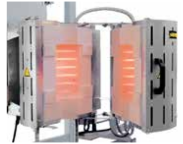
RS 100/250/11S modeli var olan bir kontrol sistemine tesis edilmek üzere, açılabilir tipte donatılmış olarak.

Biz temel modeller bazında üst konumda işlem sistemlerine de entegre edilmek üzere ihtiyaçlara yönelik varyasyonlar geliştirmekteyiz. Bu sayfada gösterilen çözümler ise var olan olanaklarımızın sadece bir bölümünü temsil etmektedir. Vakum- veya koruyucu gaz atmosferi altında yapılan uygulamalardan, yenilikçi nitelikte yönetim- ve otomatizasyon teknolojilerine kadar olmak üzere, çeşitli ısı derecelerine, ebatlara, uzunluklara ve boru tipi fırın sistemlerinin özelliklerine dek - sizin işlev optimizasyonunuz için ideal çözümü bulmaktayız.