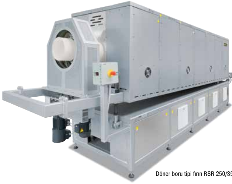
Döner boru tipi fırın RSR 250/3500/15S