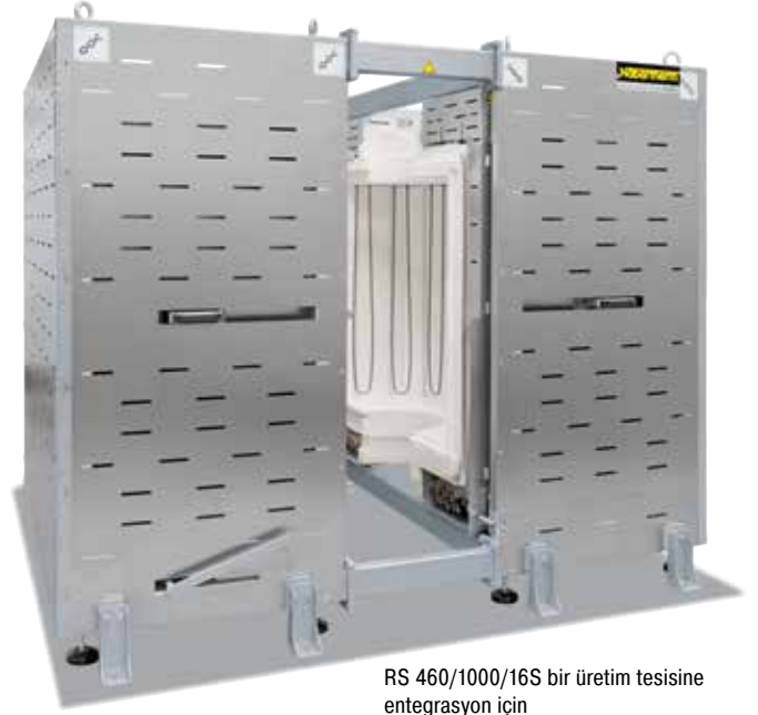
RS 460/1000/16S bir üretim tesisine entegrasyon için

Nabertherm kuruluşu tarafından yüksek derecede esneklik ve yenilikçilik anlayışının bir sonucu olarak, müşteri odaklı uygulama türleri için optimal nitelikte çözümler üretilmektedir.