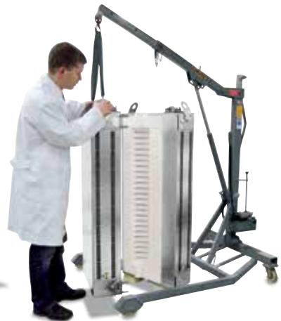
RS 120/1000/11S iki parçalı olarak imal edilmiştir. Her iki fırını bir birine benzer tasarlanmış olup, müşterinin işletmesinde bulunan bir gaz ısıtma sistemine entegre edilecektir.