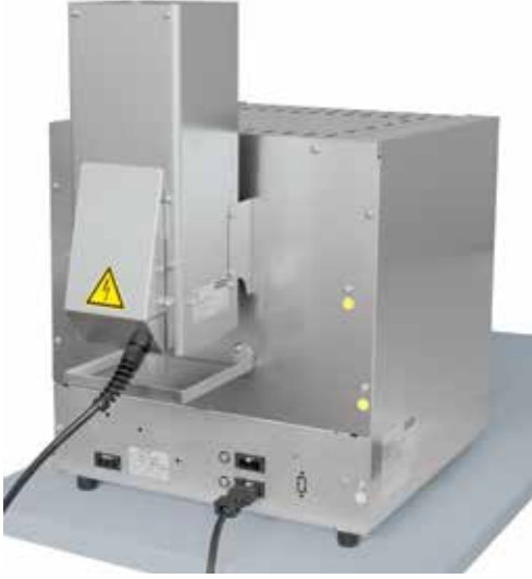
KAT 50 katalizatorli standart laboratuvar pota fırını L 5/11 bkz. Sayfa 12

Özellikle ayrıştırıcılarda egzoz temizleme için Nabertherm, prosese göre tasarlanmış egzoz temizleme sistemleri sunmaktadır. Ardıl yakıcı, fırının egzoz çıkışına sabit olarak bağlanır ve fırının kumandasına ve güvenlik matrisine uygun olarak bağdaştırılır. Elde mevcut olan fırın sistemleri için de, müstakil kumanda edilebilen ve işletilebilen, fırından bağımsız egzoz temizleme sistemleri teklif edilebilmektedir.