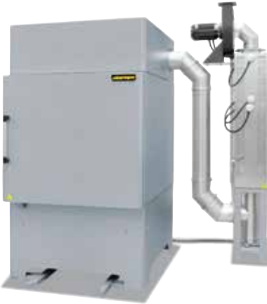
Katalitik ardıl yanma sistemli kamaralı fırın NA 500/65 DB200