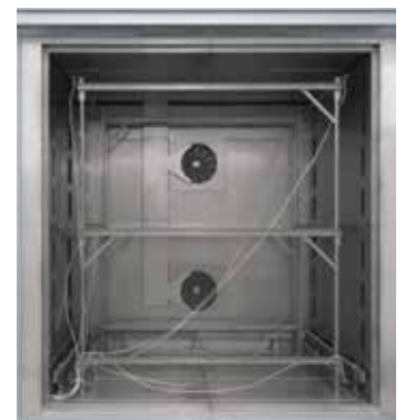
Telaio da assemblare per la misurazione nel forno a circolazione d'aria N 7920/45 HAS