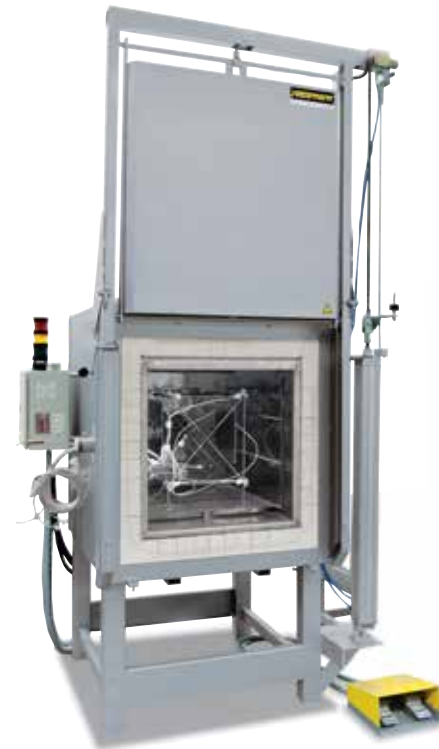
Supporto di misurazione per la determinazione dell'uniformità della temperatura

Nel forno standard è garantita un'uniformità della temperatura in +/- K senza la necessità di misurare il forno. Come dotazione aggiuntiva è tuttavia possibile ordinare la misurazione dell'uniformità della temperatura a una temperatura nominale definita nello spazio utile secondo DIN 17052-1. In base al modello del forno, nel forno si allestisce un supporto corrispondente alle dimensioni dello spazio utile. Delle termocoppie vengono fissate in questo supporto, in undici posizioni di misurazione definite. La misurazione della distribuzione della temperatura si svolge a una temperatura nominale definita dal cliente, dopo un tempo di tenuta precedentemente stabilito. Se richiesto, è possibile calibrare anche temperature nominali diverse o un determinato intervallo di temperatura.