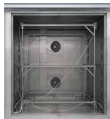
Estrutura de medição de encaixe para forno de câmara de circulação de ar N 7920/45 HAS