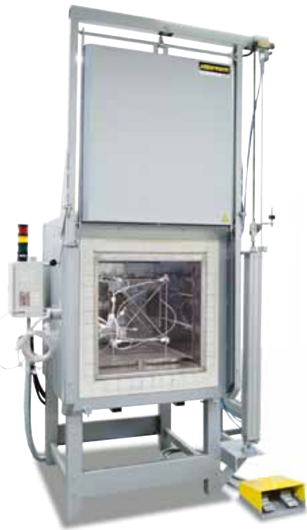
用来确定温度均匀性的测量架

在用户给定的额定温度下，在预先定义的恒温时间后进行温度分布的测量。根据要求，也可校准不同的额定温度或定义的额定工作区。