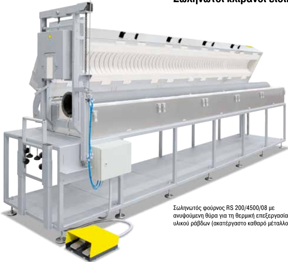
Σωληνωτός φούρνος RS 200/4500/08 με ανυψούμενη θύρα για τη θερμική επεξεργασία υλικού ράβδων (ακατέργαστο καθαρό μέταλλο)