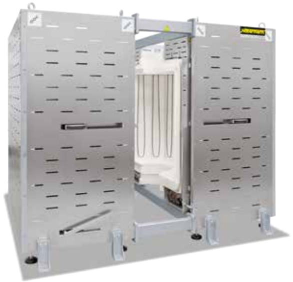
RS 460/1000/16S για ενσωμάτωση σε εγκαταστάσεις παραγωγής

Χάρη στη μεγάλη ευελιξία και καινοτομία, η Nabertherm διαθέτει την καλύτερη λύση για ειδικές εφαρμογές στα μέτρα του πελάτη.