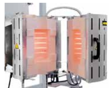
RS 100/250/11S ως πτυσσόμενη έκδοση για ενσωμάτωση σε ιδιοδιτάξεις δοκιμής