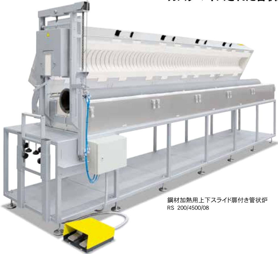
鋼材加熱用上下スライド扉付き管状炉 RS 200/4500/08