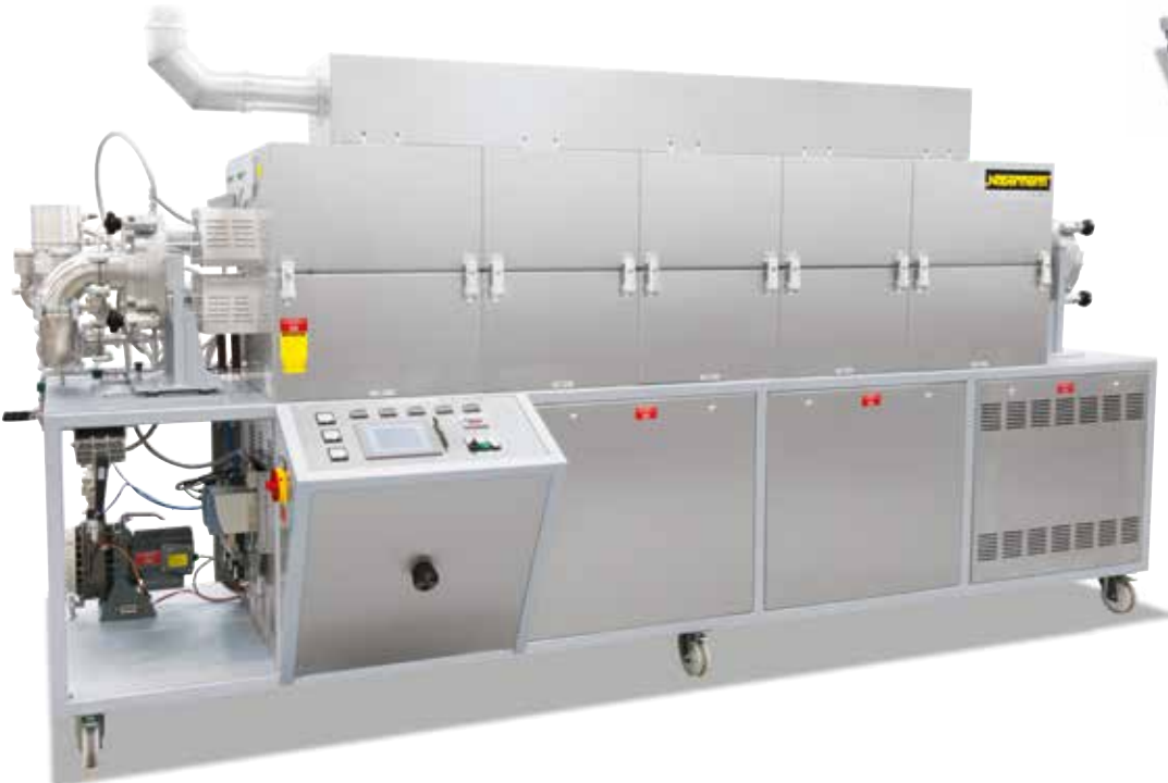
RS 250/2500/11S, beş bölümlü, tellerin yüksek vakum ve gazaltı atmosferde tavlama için, hızlı soğutma ve davlumbaz dahil