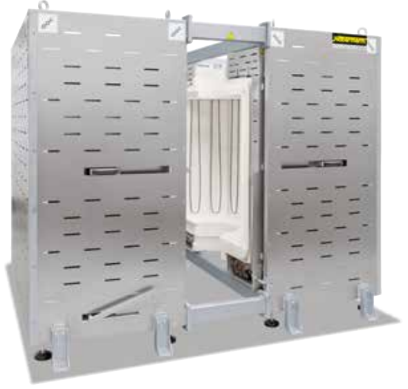
RS 460/1000/16S bir üretim tesisine entegrasyon için

Nabertherm kuruluşu tarafından yüksek derecede esneklik ve yenilikçilik anlayışının bir sonucu olarak, müşteri odaklı uygulama türleri için optimal nitelikte çözümler üretilmektedir.