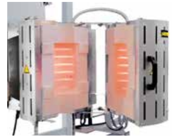
RS 100/250/11S modeli var olan bir kontrol sistemine tesis edilmek üzere, açılabilir tipte donatılmış olarak.