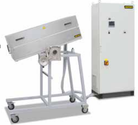
Çeşitli eğim açıları için döner sehpalı RS 120/1000/11S

Biz temel modeller bazında üst konumda işlem sistemlerine de entegre edilmek üzere ihtiyaçlara yönelik varyasyonlar geliştirmekteyiz. Bu sayfada gösterilen çözümler ise var olan olanaklarımızın sadece bir bölümünü temsil etmektedir. Vakum- veya koruyucu gaz atmosferi altında yapılan uygulamalardan, yenilikçi nitelikte yönetim- ve otomatizasyon teknolojilerine kadar olmak üzere, çeşitli ısı derecelerine, ebatlara, uzunluklara ve boru tipi fırın sistemlerinin özelliklerine dek - sizin işlev optimizasyonunuz için ideal çözümü bulmaktayız.