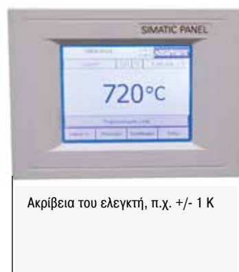
Η ακρίβεια του συστήματος προκύπτει από την πρόσθεση των ανοχών του ελεγκτή, του θερμοστοιχείου και του ωφέλιμου χώρου