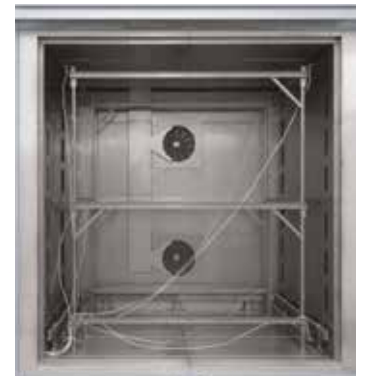
Hava dönüşümlü hazneli fırınlar N 7920/45 HAS için geçmeli ölçüm çerçevesi