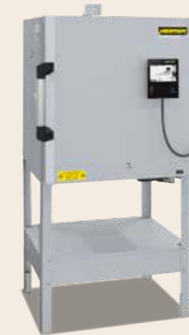
Kammerofen N 70 E von 2021