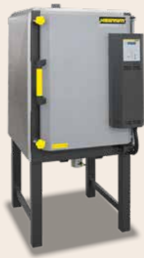
Kammerofen N 200 von 2006