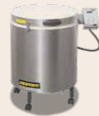
Toplader Top 60 von 2003