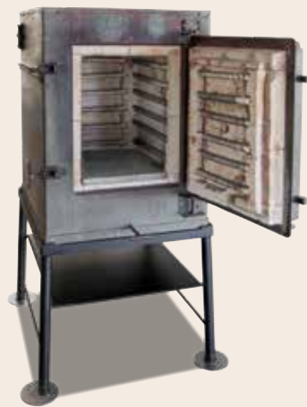
Modell 14/S von 1949