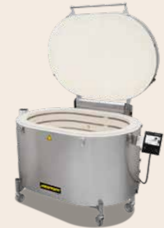
Toplader Top 220 von 2024