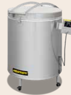
Toplader Top 100 von 2015