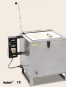
Hobbyofen Hobby 70 von 1982