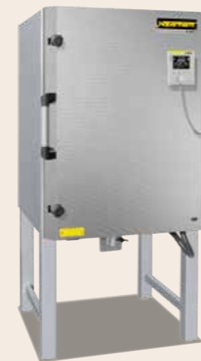
Kammerofen N 200 von 2015