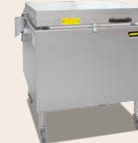
Toplader HO 100 von 2018