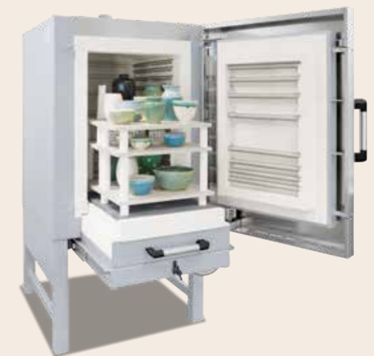
Kammerofen NW 300 von 2024