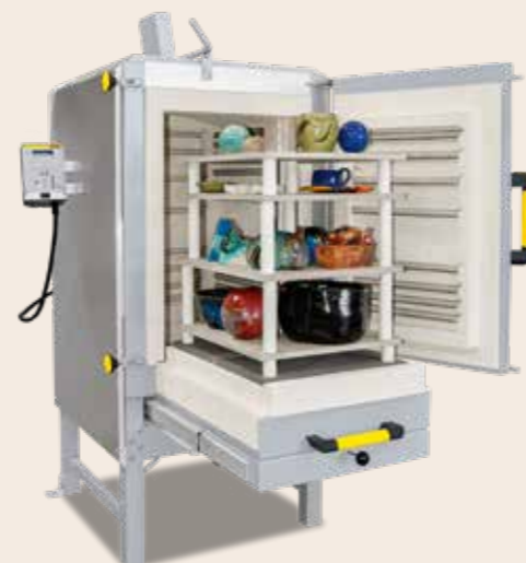
Kammerofen NW 300 von 2012